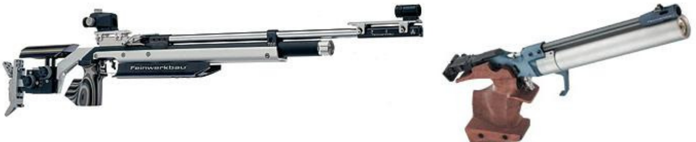
Modernes Luftgewehr und Luftpistole der Firma Feinwerkbau

Moderne Luftgewehre- und Pistolen: In letzter Zeit wurde das Schießen immer mehr modernisiert, sodass neue Technologien im Schießen Einzug erhalten. So finden heute Werkstoffe wie Aluminium und Carbon Verwendung in der Produktion der Sportwaffen. Ein weiterer Schritt ist das Schießen mit Druckluft, sodass das Spannen einer Feder oder das manuelle Vorkomprimieren der Luft entfällt und den Schützen somit entlastet.